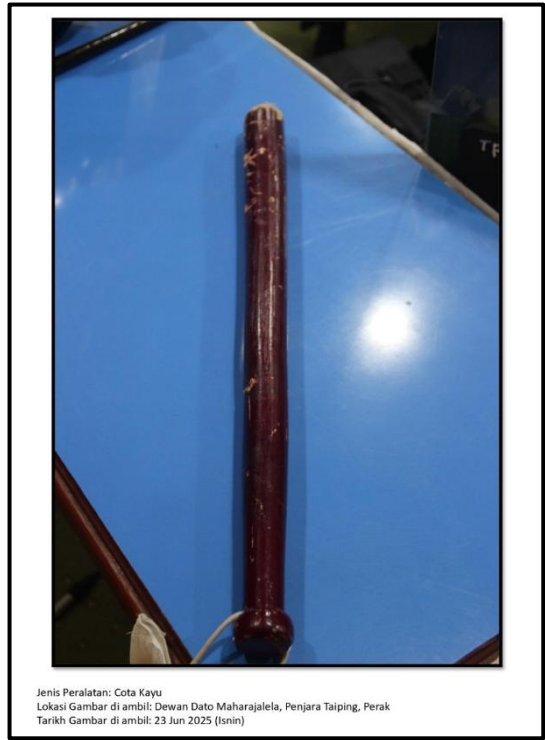
Ekshibit 41(b) - Cota Kayu