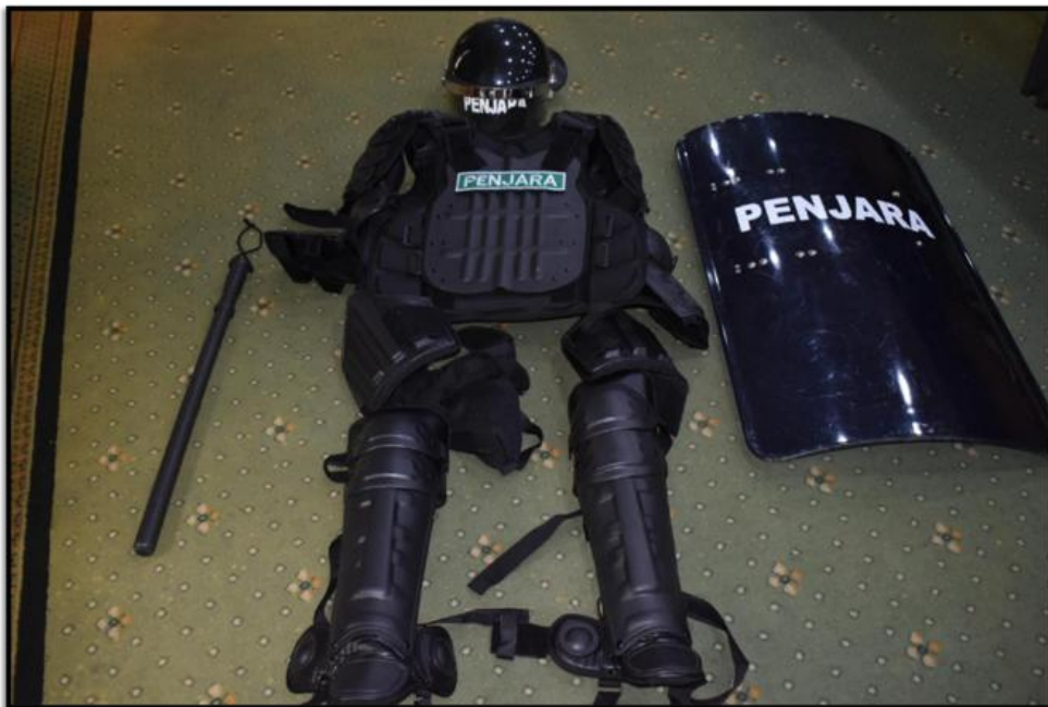
Ekshibit 41(e) - Body Armour