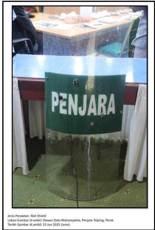
Ekshibit 41(f) – Riot Shield