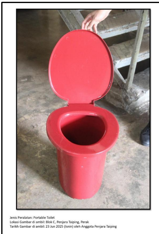
Ekshibit 87(a) - Gambar Tong 'Bucket System'