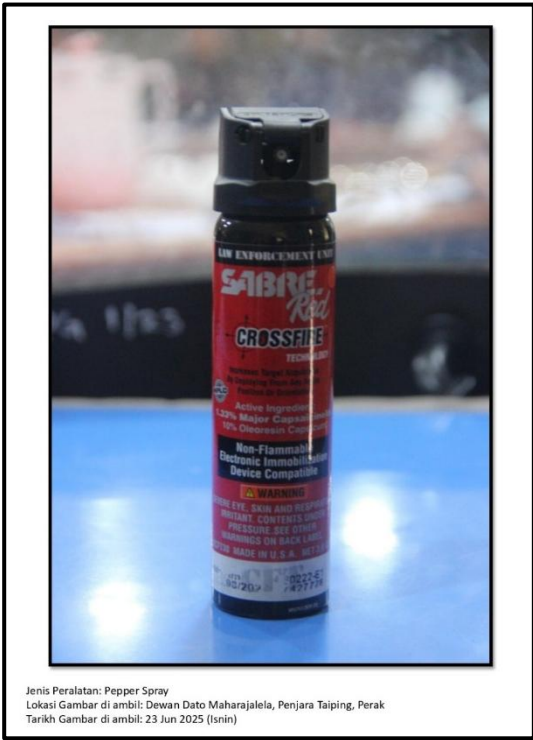
Ekshibit 41(a) - Pepper Spray