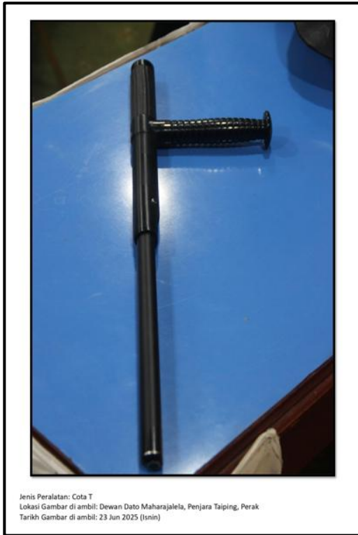
Ekshibit 41(c) - Cota-T