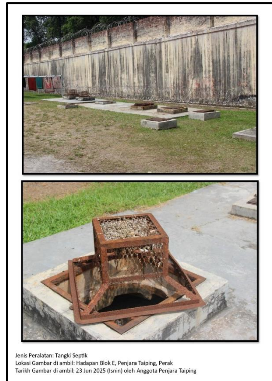
Ekshibit 87(b) - Gambar Tangki Septik